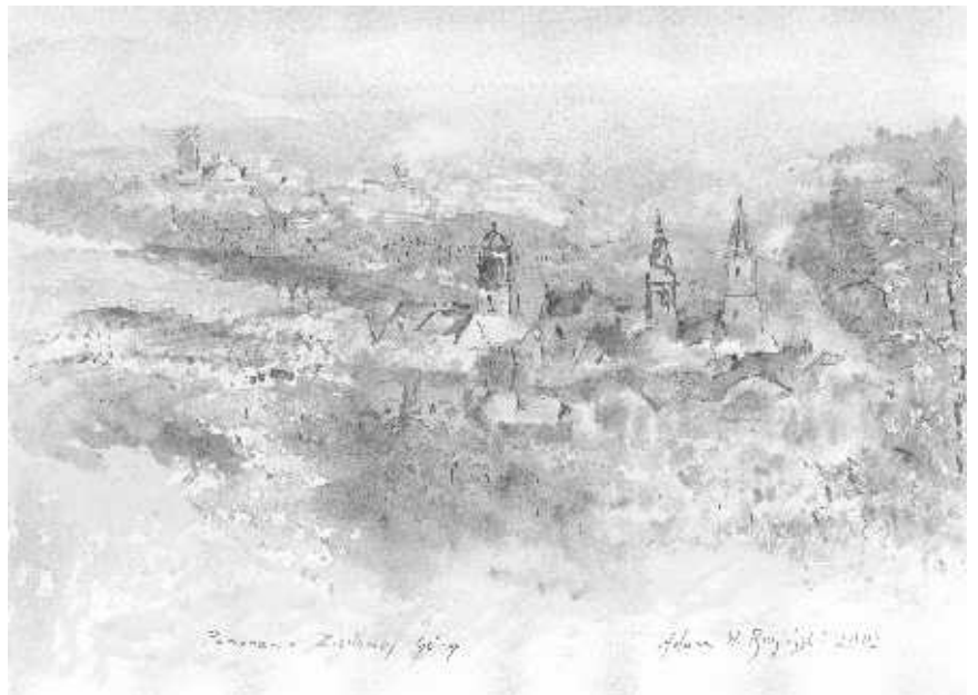
Adam Bagiński „Panorama Zielonej Góry”, akwarela, 2007