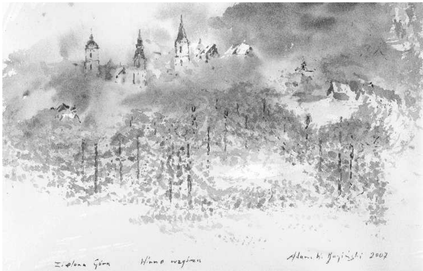
Adam Bagiński „Winne wzgórze”, akwarela, 2007