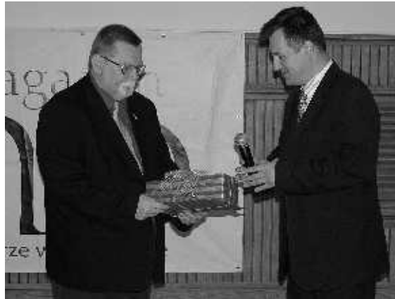
Dar władz Zielonej Góry dla Muzeum Wina