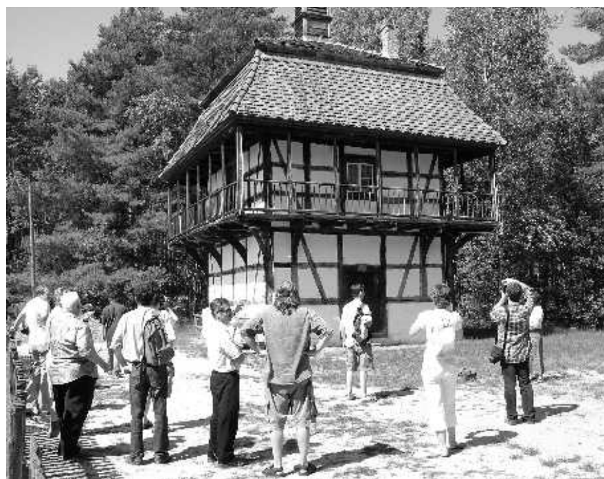
Uczestnicy Konwentu w skansenie w Ochli

Powierzchnia winnic będących własnością uczestników II Konwentu Polskich Winiarzy wynosi 41,42 ha. W najbliższych latach planują oni powiększenie swoich plantacji do powierzchni 96,16 ha. Najczęściej uprawiane przez uczestników II Konwentu odmiany to (zestawienie orientacyjne w tysiącach sadzonek): Rondo - 14,5; Cascade - 10,3; Regent - 10,1; Pinot noir - 11,4; Sibera - 3,7; Pinot gris - 3,2; Marechal Foch - 2,9; Riesling - 2,8; Seyval blanc - 2,7; Kernling - 2,5; Bianca - 2,4; Traminer - 2,4; Chardonnay - 2,1; Muskat - 2; Aurora - 1,9; Leon Millot - 1,5; Hiberna - 1,4; Dornfelder - 1; Jutrzenka - 0,8; Zweigeltrebe - 0,6.