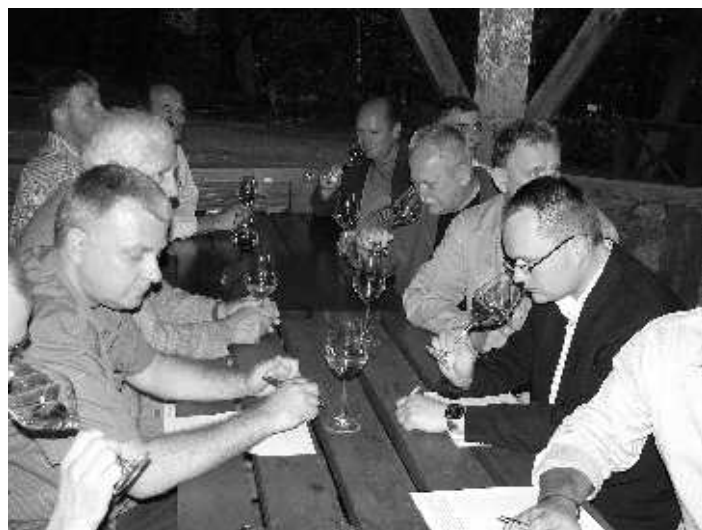
Uczestnicy konferencji w czasie nocnej degustacji win

Kolejny dzień zaczęliśmy od zwiedzania pałacowej winnicy. Mogliśmy podziwiać jej ogrom (ok. 6,5 ha), piękne położenie oraz młode nasadzenia. Stara część winnicy otrzymywała właśnie nowe rusztowania, co obejrzelśmy z ciekawością. Dla winnicy Wachtelberg, położonej na podobnej szerokości geograficznej, powstaje nowy konkurent, duma winiarzy z północnej części województwa lubuskiego.