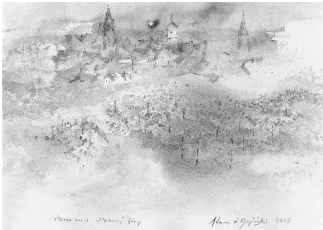
Akwarela Adama Bagińskiego „Panorama Zielonej Góry”, 2007

Po wyjątkowo w tym roku wcześniej zakończonym kwitnieniu winne krzewy zawiązały grona, których ilość zapowiada spory urodzaj. Obfite czerwcowe opady, po raz pierwszy od kilku lat tak liczne, spowodowały bujny wzrost krzewów. Ponieważ pogoda sprzyja inwazji mączniaka rzekomego, a pierwsze symptomy tej choroby już można zauważyć, należy pilnie dokonać oprysku winnic miedzianem bądź innymi środkami grzybobójczymi (np. dithane). Na kilku winnicach stwierdzono również plagę przędziorków, i to w takim nasileniu, że niektóre krzewy zostały dosłownie ogołoczone z liści.